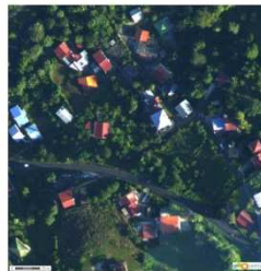
GIS MARTINIQUE - 8 La Vallée Les Gaspères, Avenue Marc-Aurèle - 97224 DUCOS - Tél : 0696 80 80 01 - j.louquet@groupe-gds.fr